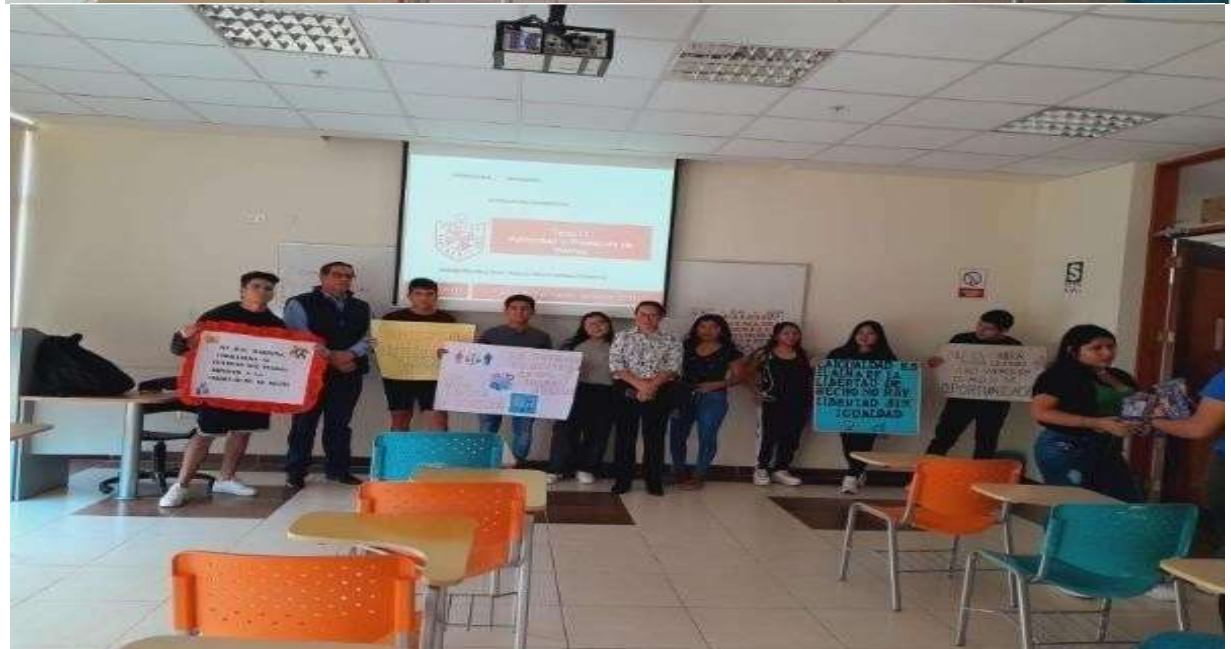
Elaborado por los Programas de Psicología, Economía, Contabilidad y Finanzas en coordinación con la responsable de la UAC FN - USMP