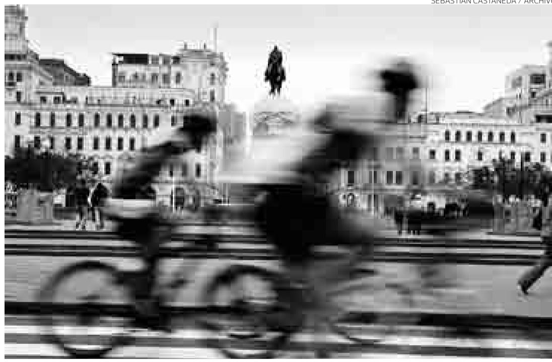
SEBASTIÁN CASTAÑEDA / ARCHIVO

Pero, así como hay buenas ideas que se quedaron en el tintero (de los alcaldes), hubo otras que no pasaron por ahí y salieron adelante. La más importante pa-